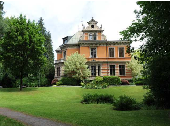
Aussenansicht Villa Claudia (Rote Villa)

(Rote Villa), Erdgeschoss, Bahnhofstraße 6