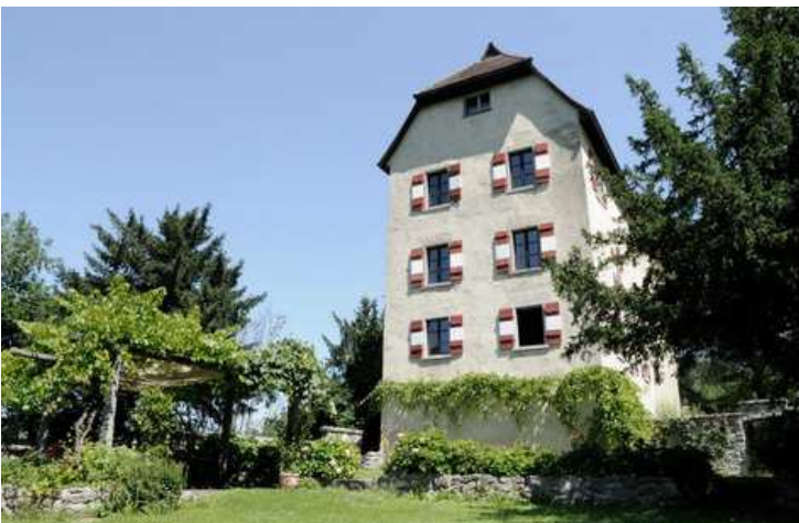
Schloss Amberg – Schlossgarten für Gartentrauung

Schloss Amberg, Amberggasse 43 Anfragen bezüglich Kosten an Jürgen Lang (Wirtschaft zum Schützenhaus) 05522/85290, www.schlossamberg.at schloss-amberg@schuetzenhaus.at