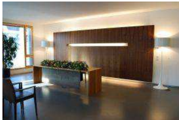
Trauraum Bregenz, Bürgerhaus

Anschrift des Trauungsraumes: 6900 Bregenz, Belruptstraße 1/2 Beschreibung: 2. Obergeschoss des Bürgerhauses Erreichbarkeit: behindertengerechter Zugang mit Lift Anzahl der Sitz- u. Stehplätze: 40 Sitzplätze und ca. 40 Stehplätze Musik: CD-Anlage vorhanden; Live-Musik möglich Blumenschmuck: Tischgesteck ist vorhanden Parkmöglichkeiten: keine eigenen Parkplätze, jedoch im Nahbereich (Rathausbezirk und Kurzparkzone) Kosten: Im Trausaal keine zusätzlichen Kosten; Bei Sondertrauungen Kosten nach Vereinbarung mit den Eigentümern Sonstiges: Sektausschank im Haus (Sitzungszimmer) möglich