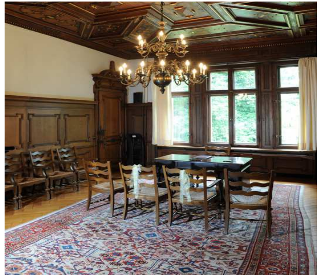
Trauraum Villa Claudia