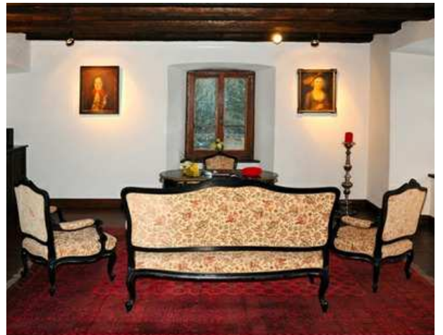
Kleiner Trauraum – Kaminzimmer, 1. OG