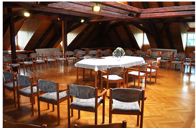
Trauraum „Alemannensaal“ in der Alten Schule

Anschrift des Trauungsräume und Beschreibung: