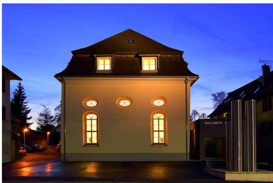
Salomon Sulzer Saal