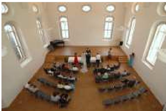
Salomon Sulzer Saal Innenansicht