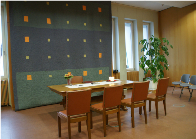
Trauraum 1. OG